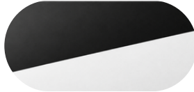
Черно / Бял