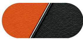
Оранжево / Черен

Стандартна цена с ДДС: EUR 32 000 / BGN 62 586