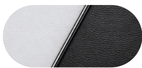
Бяло / Черен